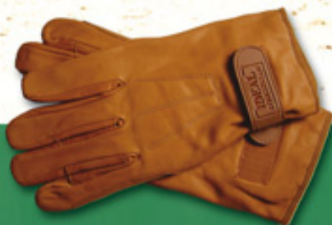
Gants de meneur