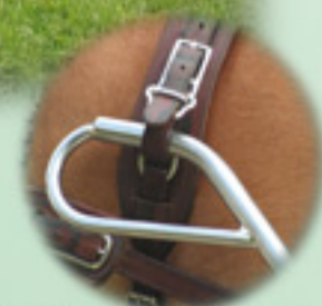
Porte-brancards de sécurité