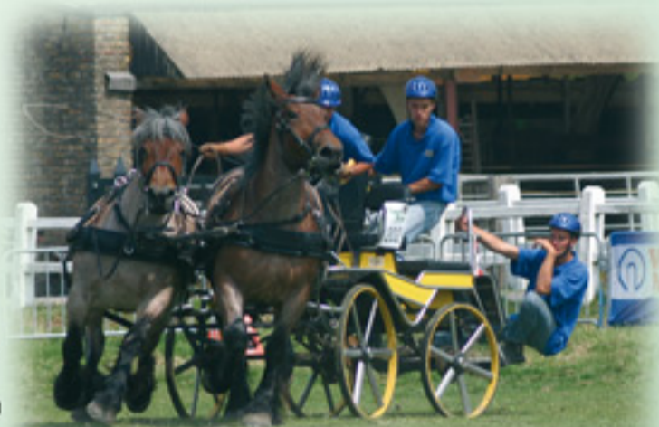
Power Horse Competition '05